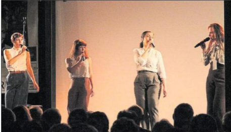
EIN VIELSEITIGES MUSIKALISCHES PROGRAMM boten „Les Brünettes“ im Gewächshaus der Firma Stärk in Weingarten.